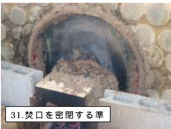
31.焚口を密閉する準