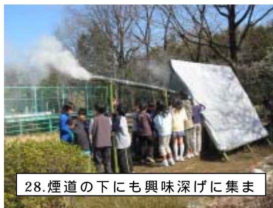
28.煙道の下にも興味深げに集ま