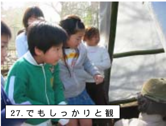
27.でもしっかりと観