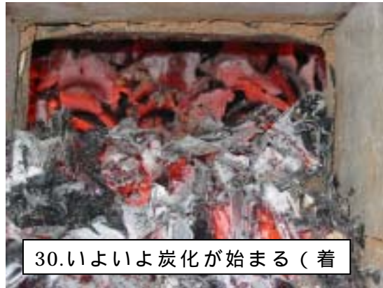
30.いよいよ炭化が始まる(着