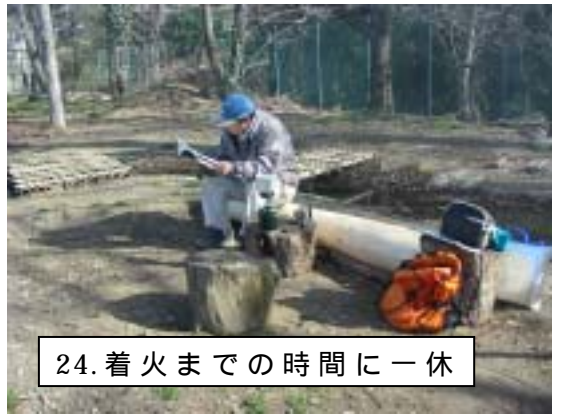
24. 着火までの時間に一休