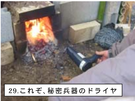
29.これぞ、秘密兵器のドライヤ