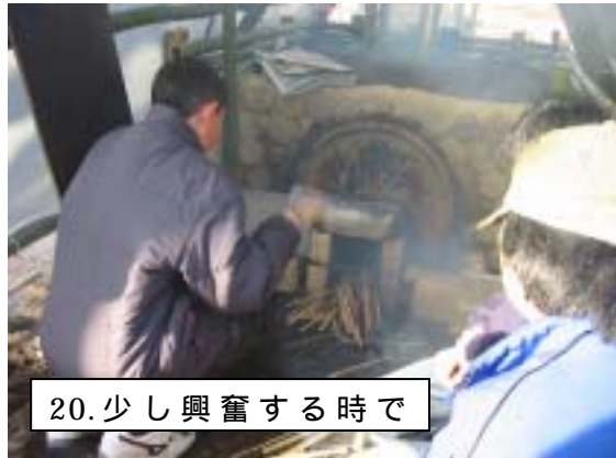
20. 少し興奮する時で