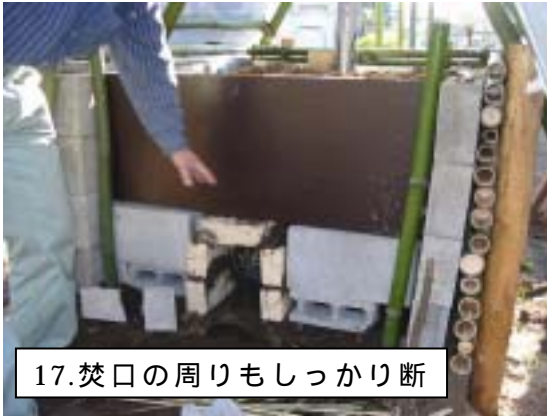
17. 焚口の周りもしっかり断