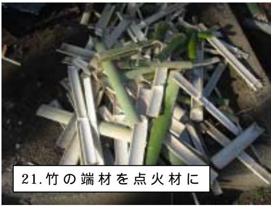
21. 竹の端材を点火材に