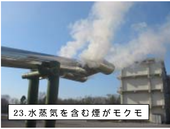
23. 水蒸気を含む煙がモクモ