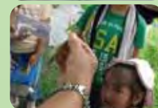
カマキリさんだ!! こわいなー