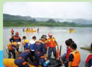
水難救助訓練とカヌー教室の風景