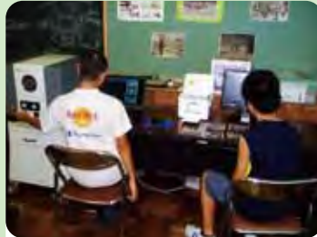
電子顕微鏡観察会

左端の丸窓のある装置が、電子顕微鏡本体です。電顕の右側に置いてあるパソコンの画面で拡大された試料を見ながら、左手で試料の位置調整をしています。