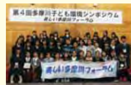
第4回の参加者と発表の模様