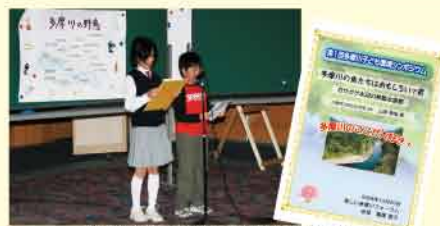
第1回の発表の様相と参加者への賞状

フォレスト・イン 昭和館 ▶ JR青柳線「昭島駅」より徒歩10分。無料送迎バスあり。