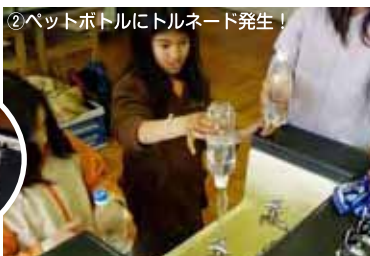
②ペットボトルにトルネード発生!

実施期日 2009.3.21(土) 場所 たまがわ・みらい・パーク 行事名称 水のふしぎ発見