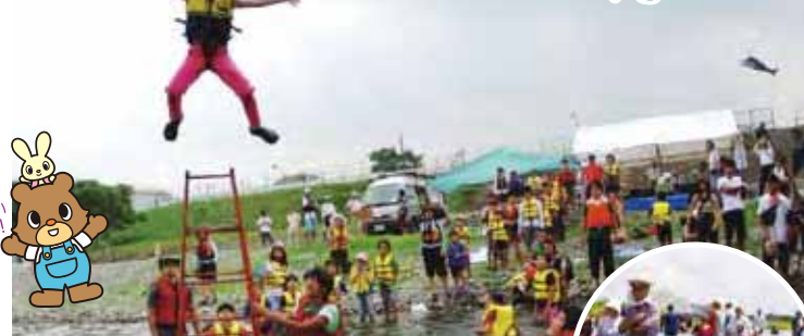
夏休み親子多摩川教室の一コマ