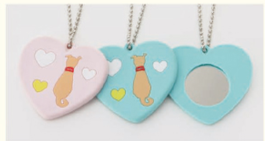
渋谷のシンボル「ハチ公」をモチーフにしたデザイン 東急百貨店オリジナル〈渋谷のしっぽ〉 ラバーミラーチャーム(ピンク・ブルー) 各200円(税込) ※数量に限りがございますので、売切れの際はご容赦願います。 ※販売場所など、詳しくは売場係員におたずねください。 ※写真はイメージです。 ※お支払いは現金のみとさせていただきます。

東急百貨店オリジナル〈渋谷のしっぽ〉ラバーミラーチャームの売上金の一部は「美しい多摩川フォーラム」を通じ、多摩川の環境保全活動に役立てられます。多摩川水系は東京都の水源として19%使用されており、上流の奥多摩湖では緊急時対策用として貯水されています。次代を担う子どもたちのためにも、美しい多摩川を守りましょう。