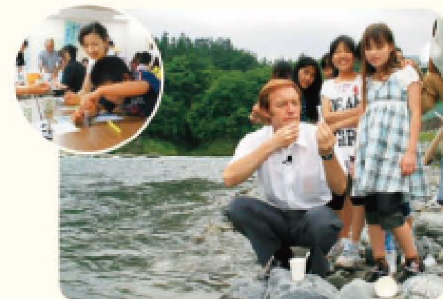
多摩川一斉水質調査の様子