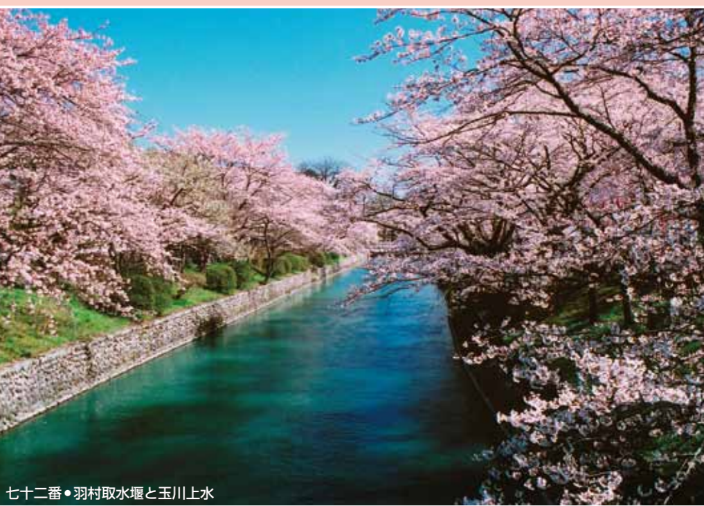
七十二番・羽村取水堰と玉川上水