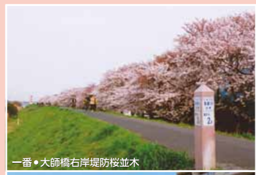
一番・大師橋右岸堤防桜並木

「夢の桜街道」に人々が集まることで賑わいが生まれ、ビジネスが育ち、地域に活力が生まれます。