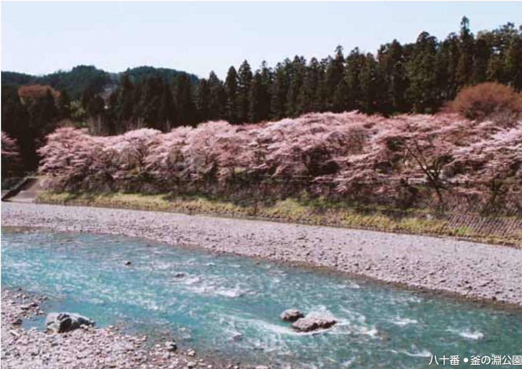
八十番・釜の淵公園