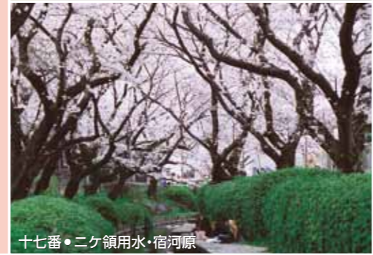
十七番・二ヶ領用水・宿河原