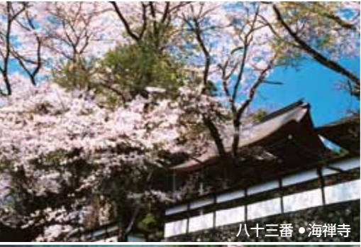
八十三番・海禅寺