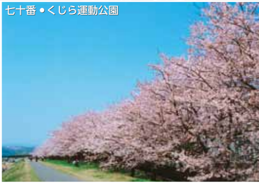
七十番・くじら運動公園