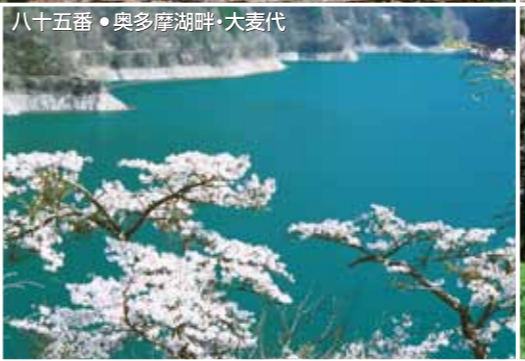
八十五番・奥多摩湖畔・大麦代