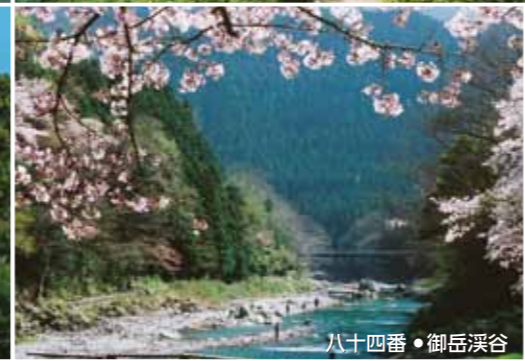
八十四番・御岳溪谷