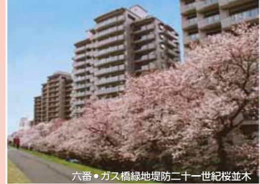
六番・ガス橋緑地堤防二十一世紀桜並木