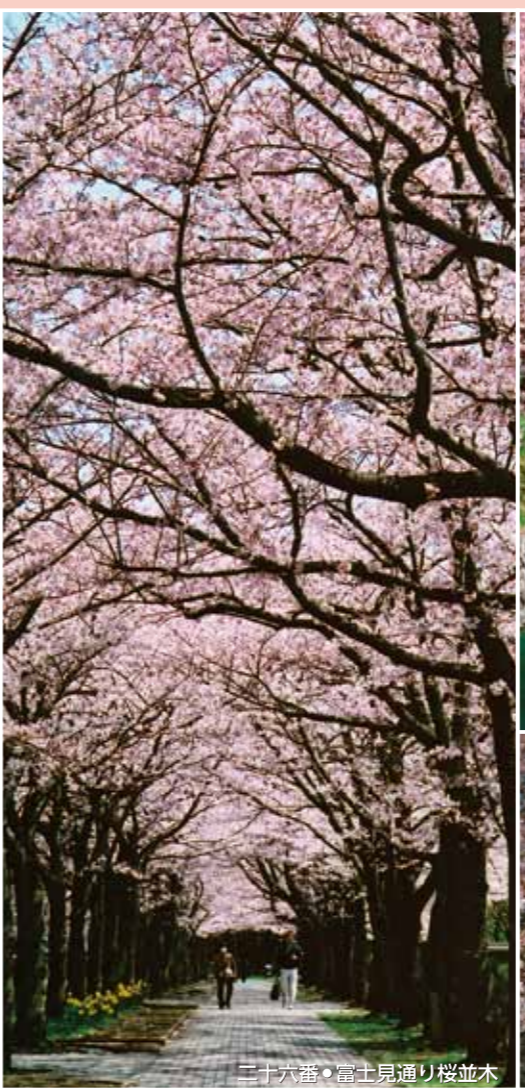
二十六番・富士見通り桜並木