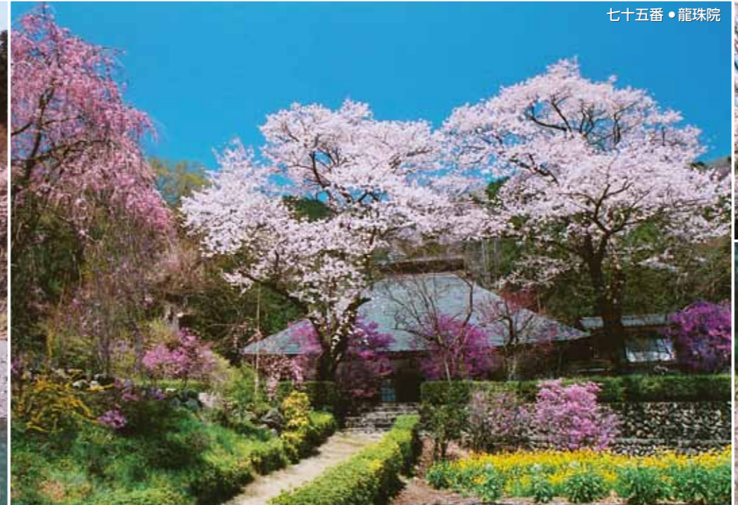
七十五番・龍珠院