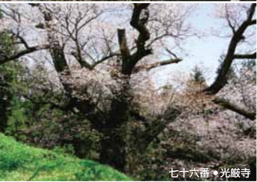
七十六番・光厳寺