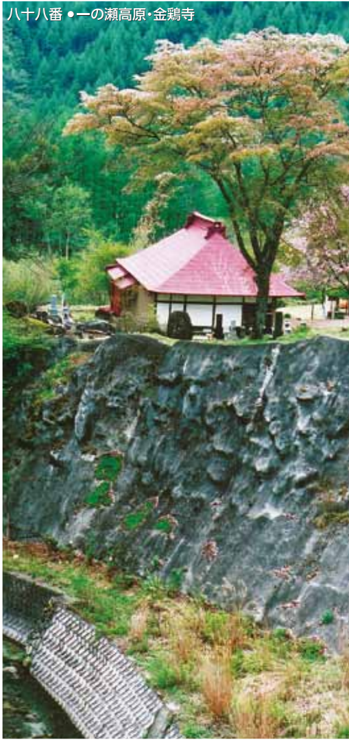
八十八番・一の瀬高原・金鶏寺