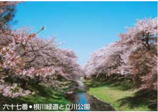
六十七番・根川緑道と立川公園