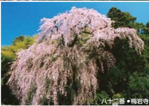
八十二番・梅岩寺