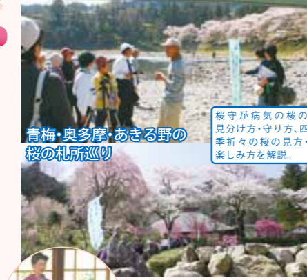
青梅・奥多摩・あきる野の桜の札所巡り