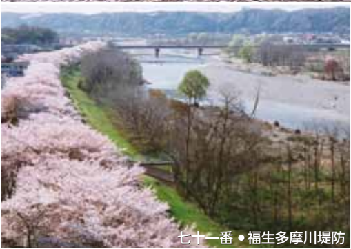
七十一番・福生多摩川堤防