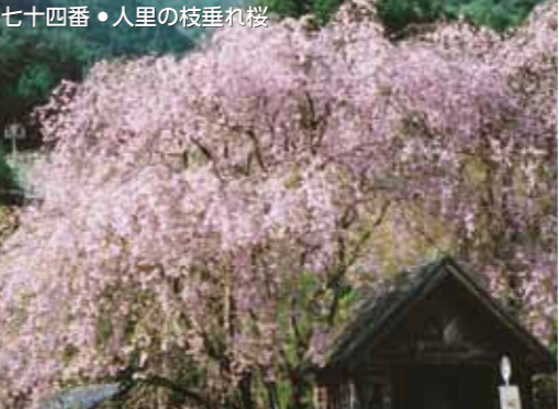
七十四番・人里の枝垂れ桜