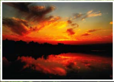
「美しい絵画の世界」