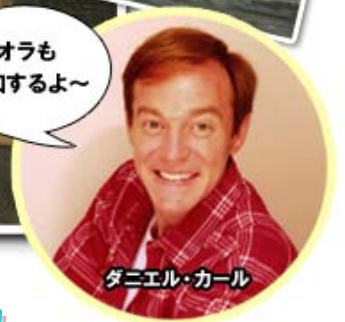
ダニエル・カール